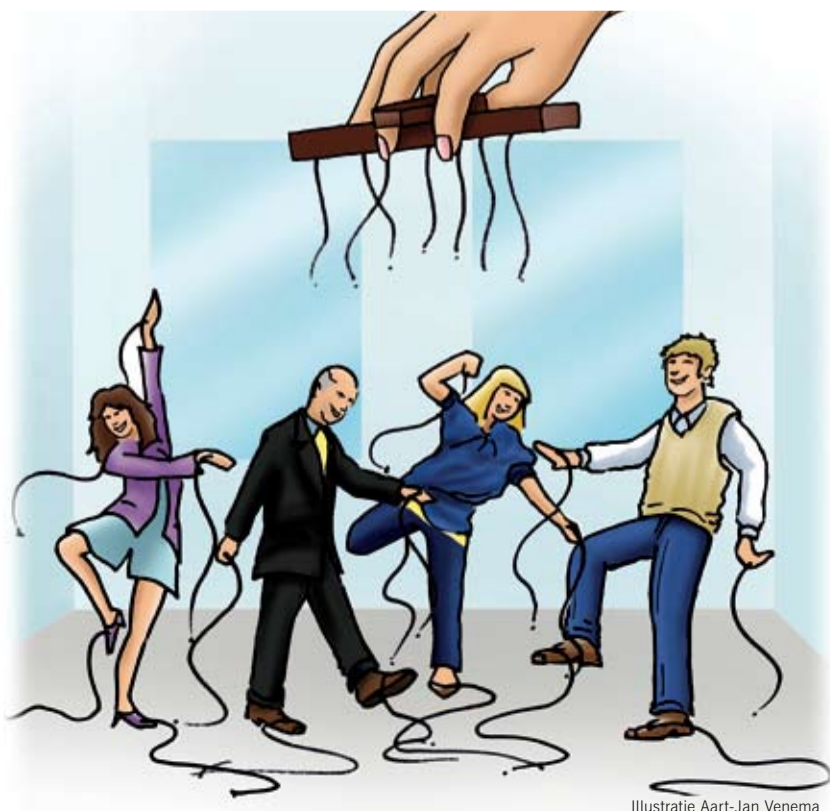
Illustratie Aart-Jan Venema

stimuleer innovatie en diffusie van innovatie in het openbaar bestuur. De auteurs beschrijven op een beeldende en integere manier wat maakt dat de commissie InAxis niet meer bestaat. Daarnaast is de beschrijving van het proces van diffusie en adoptie van goede voorbeelden interessant. Het gehele artikel is te vinden in de kennisbank van het NCSI.